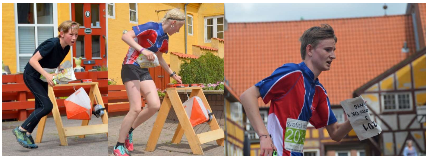
Fuld fart på i Horsens Midtby