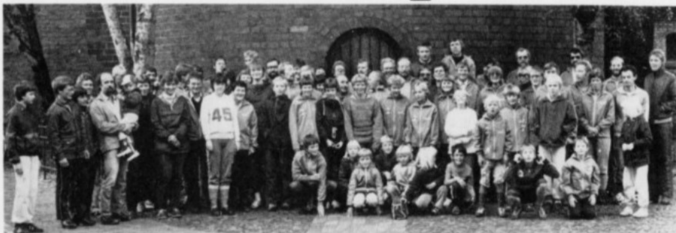
Horsens Orienteringsklub blev med sine 85 deltagere den bedst repræsenterede klub ved Cup-finalen. Her er de samlet før afgang til Alum-Fussingø skovene.

Horsens Orienteringsklub sluttede som nummer 3 og sidst ved Cup-finalen i Alum-Fussingø skovene ved Randers i weekenden. Cup-finalen er et uofficielt danmarksmesterskab for hold.