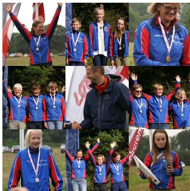
Medaljeregn i 2014