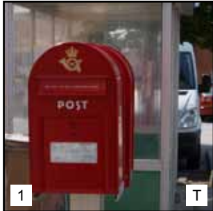
Foto-orientering er lavet i samarbejde med Hedensted Kommune og Horsens Orienteringsklub. God fornøjelse!