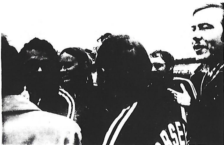
TILFREDESE HORSSENS O.K.ere EFTER SIDSTE LØB I 71 I OXBØL