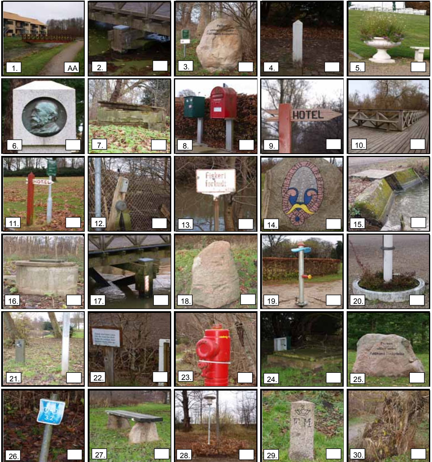
Foto-orientering er lavet i samarbejde med Horsens kommune og Horsens Orienteringsklub. God fornøjelse!

Se godt efter når du er ved posten, så du vælger det rigtige foto. På nogle af billederne er der kun vist en detalje af en større ting. Du kan skrive postens bogstav i det tomme felt i det billede, du mener, der er det rigtige..