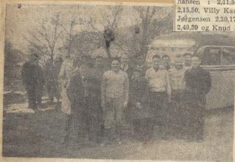
H. J. S.'s Orienteringsløbere, der gjorde saa fin en Indsats i Viborg, fotografereet umiddelbart efter Hjemkomsten

LØBET I DALGAS PLA. VED VIBORG d. 30-3-52