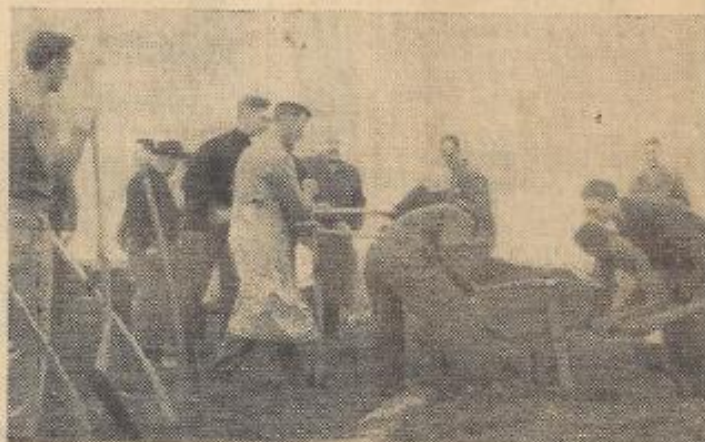
Et Kvarter efter var Arbejdet i fuld Gang, og saavel Divisionsspillet som Bestyrelsesmedlemmer tog aktiv Del i Grundgravningsarbejdet.